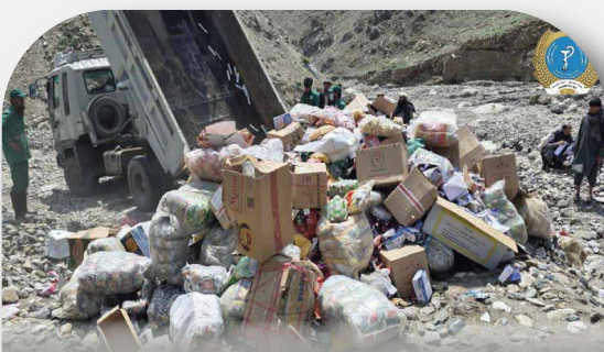
More than 11 Tons of Expired and Substandard Food Items and Medicines Destroyed in Kunar Province.

These items, which had been collected from various areas by inspection and monitoring officials of the Provincial Public Health Directorate, were destroyed in the presence of relevant authorities.