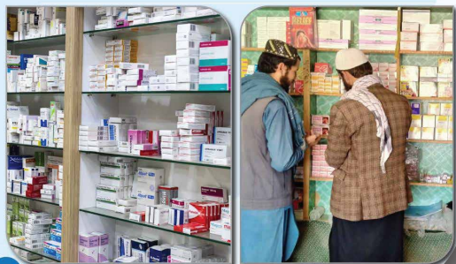
نظارت بر مواد خوراکی و ادویه

ر سکتور خصوصی صحی، عمده فروشۍ های ادویه و فروشگاه های مواد خوراکی در ولایت پکتیکا نظارت صورت گرفت.