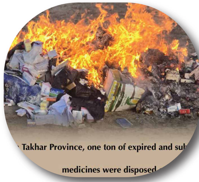
Takhar Province, one ton of expired and substandard medicines were disposed