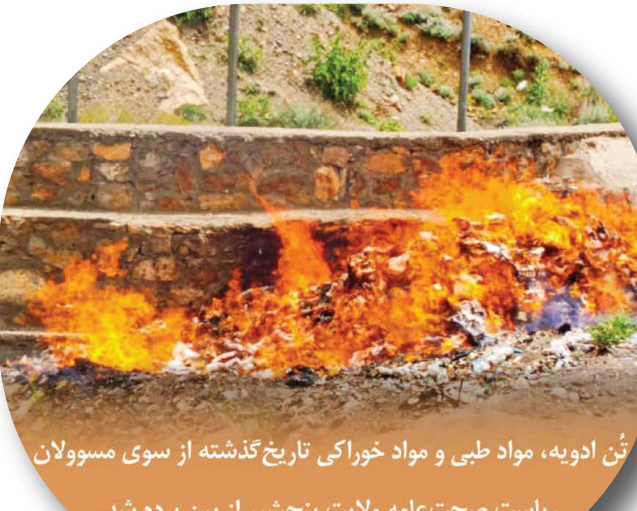
14 تن ادویه، مواد طبي و مواد خوراکی تاریخ گذشته از سوی مسوولان ریاست صحت عامه ولایت پنجشیر از بین برده شد.