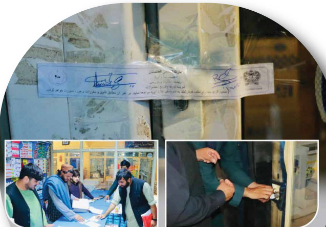
Monitoring and Inspection Directorate of the Afghanistan Food and Drug Authority, under the Ministry of Public Health, carried out an inspection of 12 wholesale pharmacies in the Hotel Parwan area of District 11.

Spokesperson, Information & Public Relation Directorate